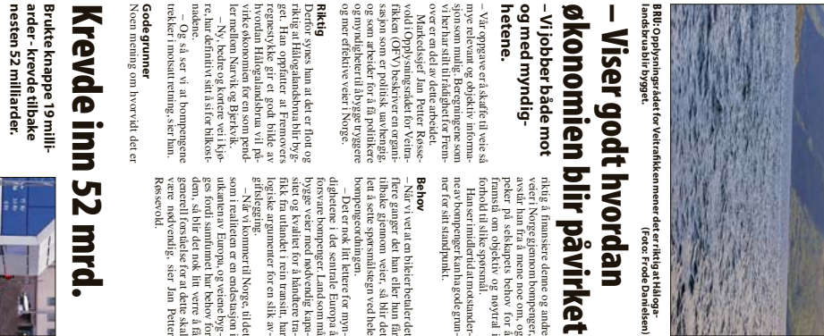
SEB REIL TIL NR BI: Det er viktig å vise hvordan økonomien blir påvirket av ulike tiltak. Dette vil være en betydelig besparelse for mange bilpendlere som har 20 000 kjøretimene i året.

– Det er viktig å vise hvordan økonomien blir påvirket av ulike tiltak. Dette vil være en betydelig besparelse for mange bilpendlere som har 20 000 kjøretimene i året.