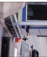
STATEN vil innføre 5,5 milliarder kroner i tillegg til de 200 milliardene som er planlagt for Hålogalandsbrua. Dette vil være en betydelig besparelse for mange bilpendlere som har 20 000 kjøretimene i året.

– Det er viktig å vise hvordan økonomien blir påvirket av ulike tiltak. Dette vil være en betydelig besparelse for mange bilpendlere som har 20 000 kjøretimene i året.