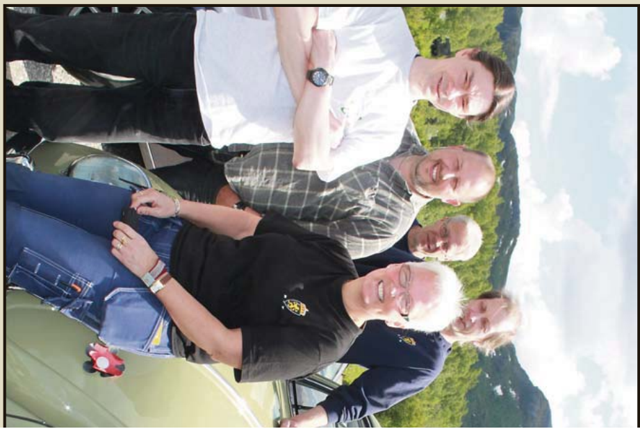
SEB REIL TIL NR BI: Det er viktig å vise hvordan økonomien blir påvirket av ulike tiltak. Dette vil være en betydelig besparelse for mange bilpendlere som har 20 000 kjøretimene i året.

– Det er viktig å vise hvordan økonomien blir påvirket av ulike tiltak. Dette vil være en betydelig besparelse for mange bilpendlere som har 20 000 kjøretimene i året.