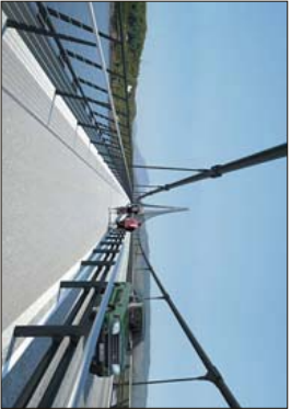
MA DET REKT SITT vil koste deg å passe på Hålogalandsbrua, anbygger nye avvikler bil du har, og om dukkeler å oppnå skattemessig fradrag for bompenge.